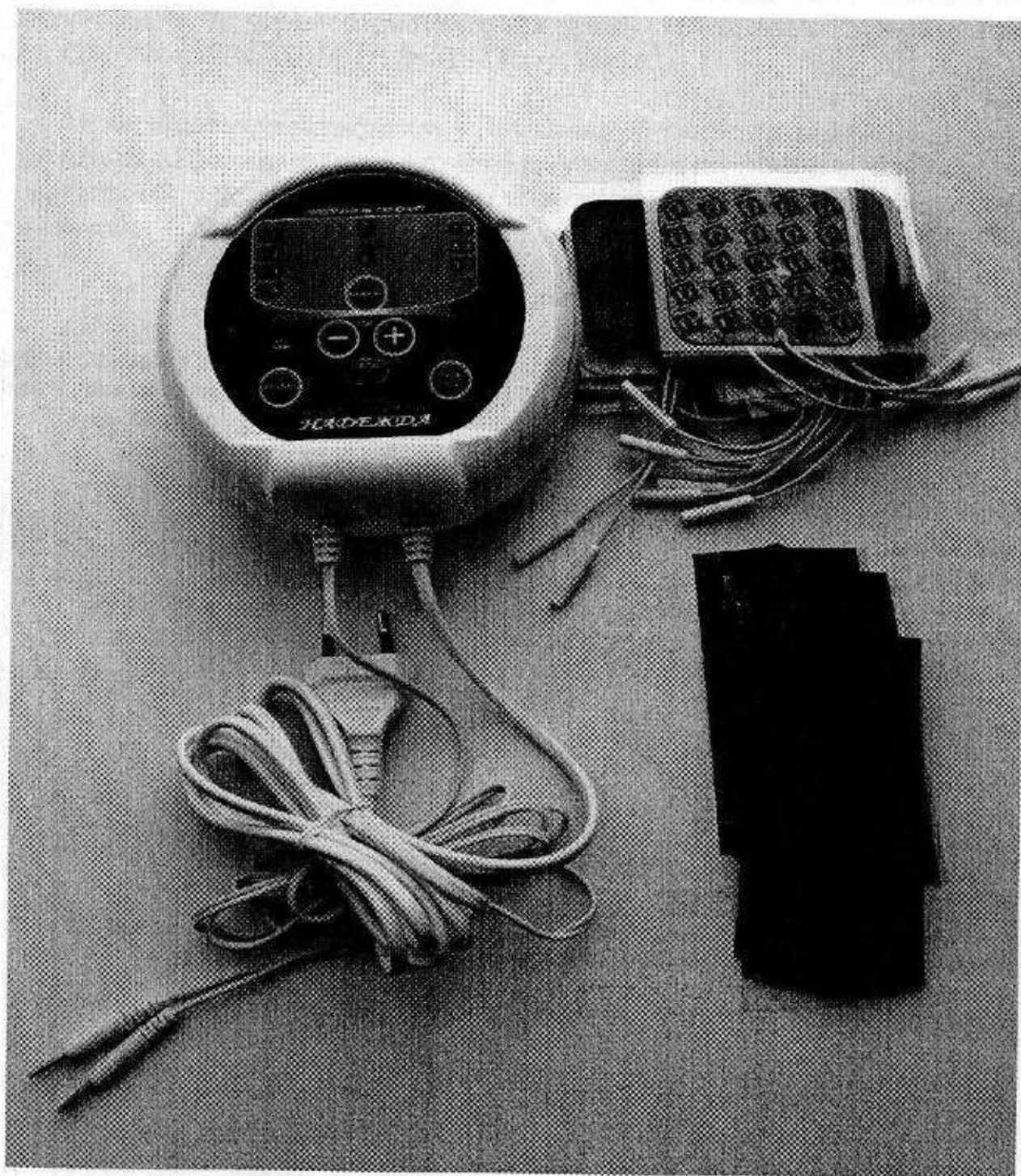
Аппарат физиотерапевтический НАДЕЖДА