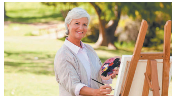
А кто-то выбирает «Глазник»