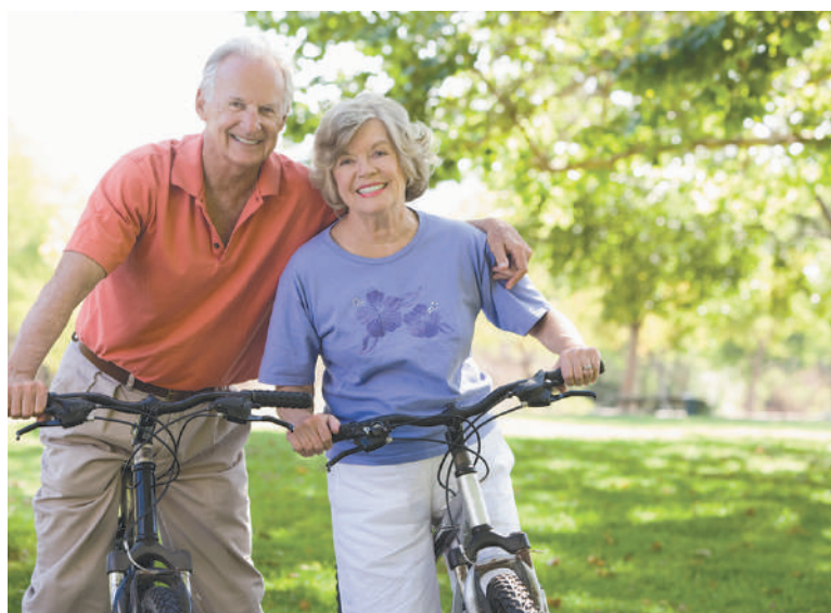
РИКТА ЭСМИЛ 1А – Ваше спасение!

Там, куда таблеткам не добраться, куда проникнуть может только скальпель хирурга, лазер сможет